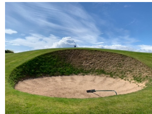
Die Fahne ist kaum zu erkennen!