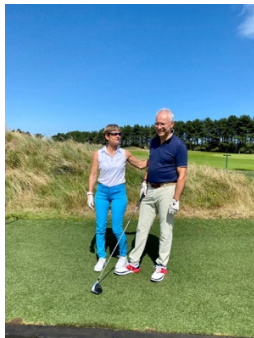
So schlimm wird es nicht werden...

Die fünf verschiedenen 18-Loch Golfplätze (Irvine, Barassie, Dundonald, West Kilbride und Routenburn) hatten alle ihre ganz eigenen Schwierigkeiten, aber auch Schönheiten. Manchmal war es etwas zum Verzweifeln, der starke Wind war ebenfalls meist nicht hilfreich, um die Fairways zu treffen. Die tiefen Topfbunker taten ihr Übriges, den Schwierigkeitsgrad zu erhöhen – aber gleichzeitig auch den Spassfaktor.